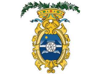
Provincia di Salerno