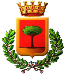
Comune di Pagani